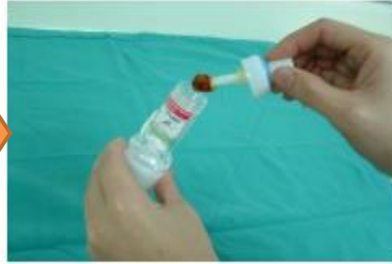
挖取一粒花生米大之糞 便放入容器中