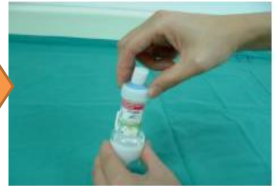
將蓋子蓋回關緊 放入夾鏈袋中