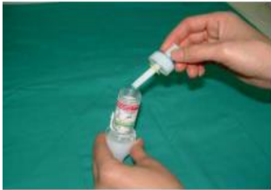
打開糞便收集盒 取出採檢棒