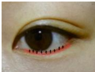
（ 在下眼瞼結膜內做切口 ）