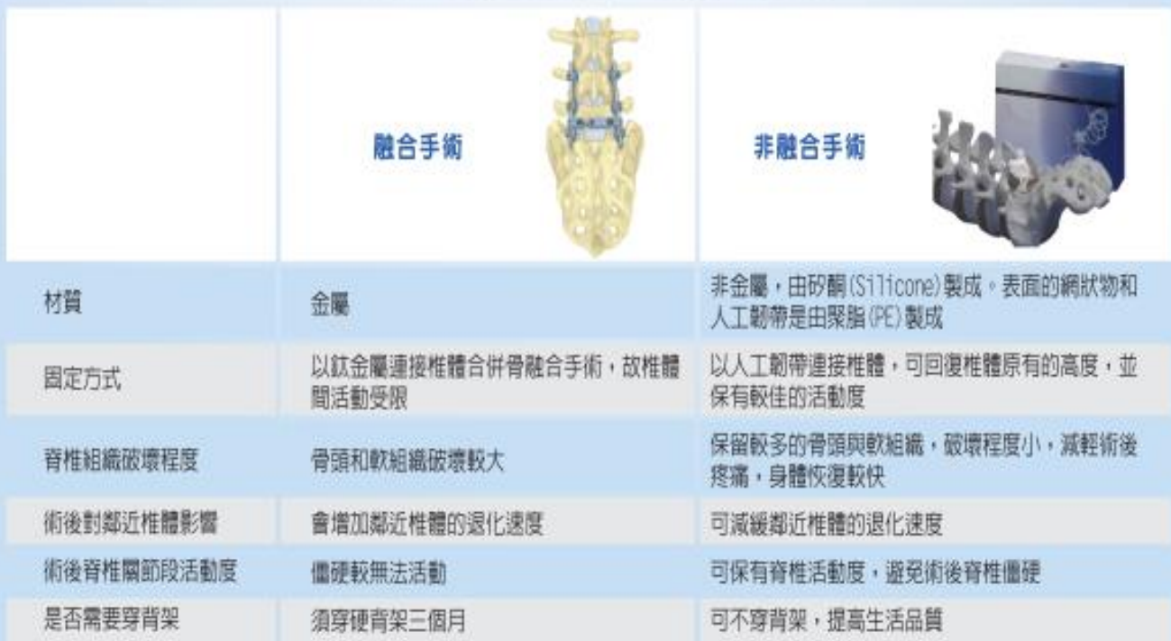
融合手術與非融合手術比較表