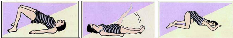
圖 4 陰道收縮運動圖 5 腿部運動圖 6 子宮收縮運動